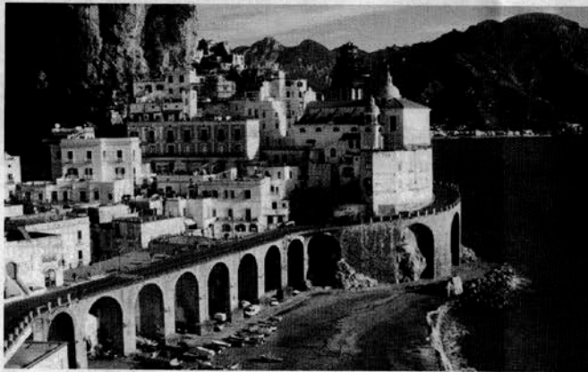
la costiera amalfitana, uno degli scenari preferiti per i matrimoni di lusso. Sotto: Venezia

Secondo JFC Tourism & Management, lo scorso anno il settore ha prodotto oltre 1 milione e 221 mila presenze da 25 Paesi e un fatturato complessivo di 315 milioni di euro. E