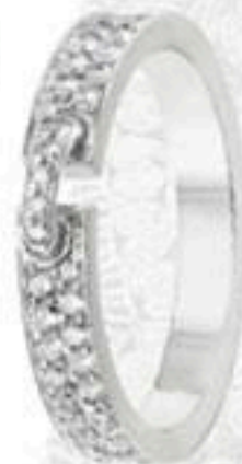
Кольцо Liens, белое золото, бриллианты, Chaumet