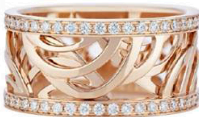
Кольцо Aria, розовое золото, бриллианты, De Beers