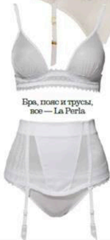
Бра, пояс и трусы, все — La Perla

Свадебное белье не просто наряд для первой супружеской ночи, но и невидимый помощник, который будет моделировать фигуру и поддерживать грудь под платьем-бюстье целый день. Советуем определиться с фасоном заранее, а лучше — запастись разными комплектами для каждой из задач.