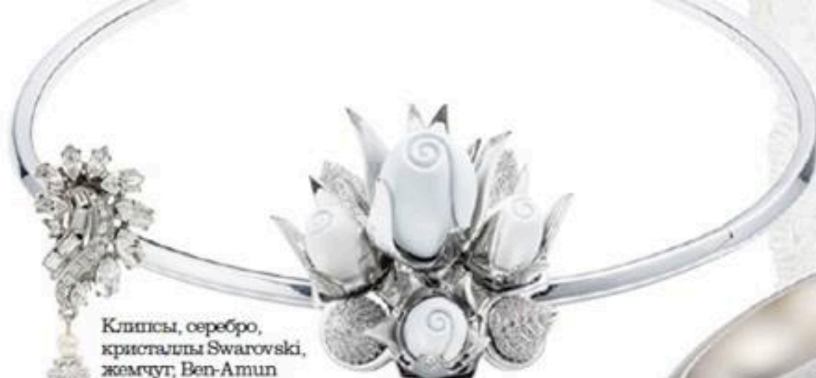
Колье Rose Cluster, латунь, кристаллы, керамика, Eddie Borgo

Классика или АВАНГАРД, платина или золото? Некоторые пары берут сразу НЕСКОЛЬКО комплектов обручальных колец