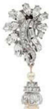
Клипсы, серебро, кристаллы Swarovski, жемчуг, Ben-Amun