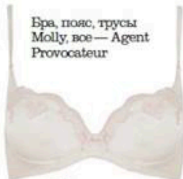
Бра, пояс, трусы Molly, все — Agent Provocateur