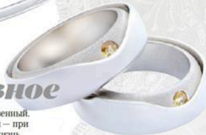
Кольца «Ясность», белое золото, цитрин, Alchemia Jewellery

Выбор кольца — самый ответственный. Это украшение останется с вами — при идеальном сценарии — на всю жизнь. De Beers этой весной радует классикой в новом металле и оттенке (розовом золоте), Chaumet делает ставку на безупречную модель Liens, а молодой бренд Alchemia Jewellery экспериментирует с минималистским дизайном.